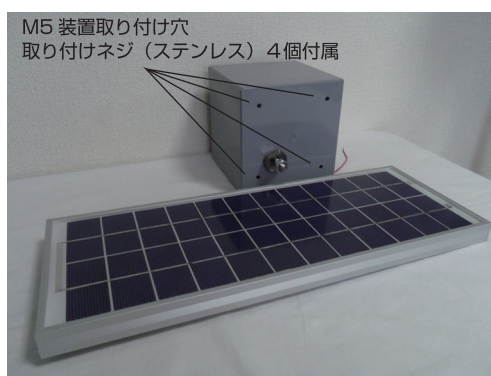
ソーラーパネル × 2